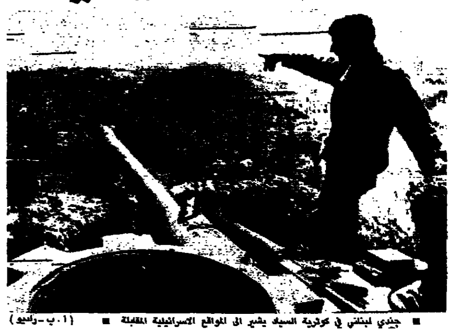
جندي لبناني في كوتريّة السيّد يشير إلى مواقع الاسرائيلية المخفية

من المفارقات ان يتجرع الوضع الأمني على جبهة الجبل وتتوسع رقعة القصف العشوائي فيما يخوض الجيش اللبناني أول معركة مع الجيش الإسرائيلي في الجنوب ويمنع من اختراق خطوطه الامامية. وقد اعطى التفجير الأمني الذي يدخل في خانة الخلاف السياسي بين أهل الحكم انطباعاً بفشل الجهود السياسية الهادفة إلى وضع مشروع سياسي متكامل في ضوء الاتفاق الذي تم في مكابا بين الرئيس أمين الجميل ونائب الرئيس السوري السيد عبد الحليم خدام. إلا ان هذا الانطباع بدده الاتصال الذي أجراه الرئيس أمين الجميل مع الرئيس حافظ الأسد مساء أمس.